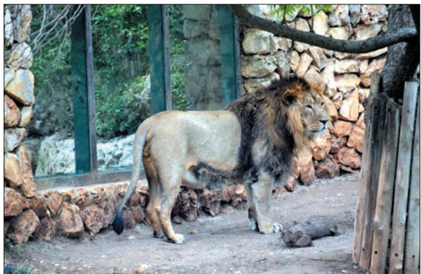
Ázsiai oroszlán a jeruzsálemi Bibliai Állatkertben

Egy izraeli újságíró videóra rögzítette, amint a Jeruzsálemben található Bibliai Állatkertben egy oroszlán éppen a látogatók szeme láttára fogyaszt el egy fehér nyulat. A felvétel háttérben hallatszódik a bámszokó szülők és gyerekek értetlenkedése a látottak miatt, olvasható a Kibicben.