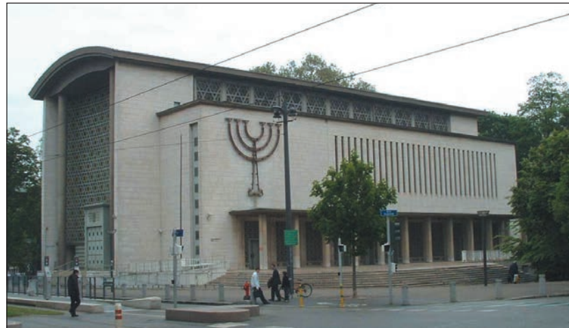
A strasbourgi Béke nagyzsingóga

jelent a generációk között. Az elmúlt évtizedekben a zsinagógát különböző célokra használták. Változást jelentett, hogy 2014-ben az akkor 16 éves Ery Parvulescu holokauszt-émlékünnepséget rendezett az egykori templomban, amit más programok követtek. 2016-ban a közösség visszaszerelte az épületet. A hitközségi el-