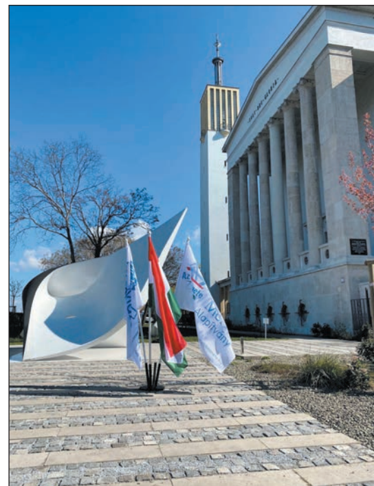
Kelemen Zénó alkotása

Az este utolsó eseményeként felavattuk Kelemen Zénó alkotását, az Embermentők emlékművet. Mi, az Élet Menete Alapítvány képviselői valljuk, hogy az áldozatokról való megemlékezés mellett kötelessé-