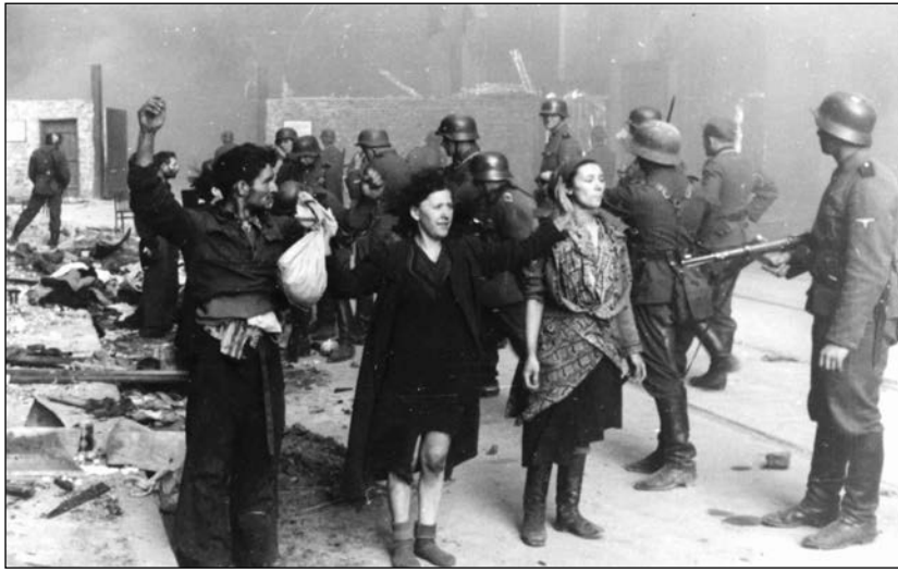
Német katonák elfogott felkelőkkel

A németek a gettót kívülről őrizték, a belső rendet a zsidó rendőrség tartotta fent, de inkább csak hajtóvadászatokat rendezett és az emberek rejtgették vagyonát kereste. Míg a többség csak vegetált, a gettó csempészekből, feketézókból álló „arisztokráciája” óriási összegeket keresett. A németek utasításait a Zsidó Öregek Tanácsa (Judenrat) hajtotta végre, miközben próbálta az életet elviselhetőbbé tenni. Az embertelen körülmények ellenére az ott lakók ingenykon-