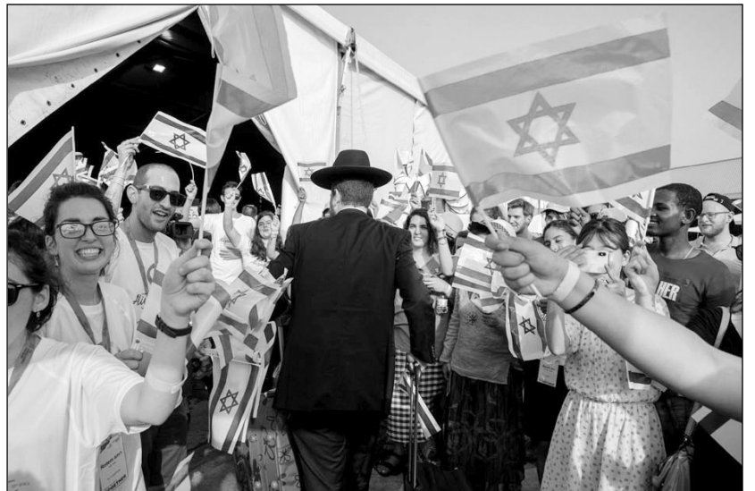
Alijázók fogadása Izraelben

A világ zsidóságának több mint 83 százaléka két országban, Izraelben (6,8 millió) és az Egyesült Államokban (5,7 millió) él. A fenti két országot Fran-