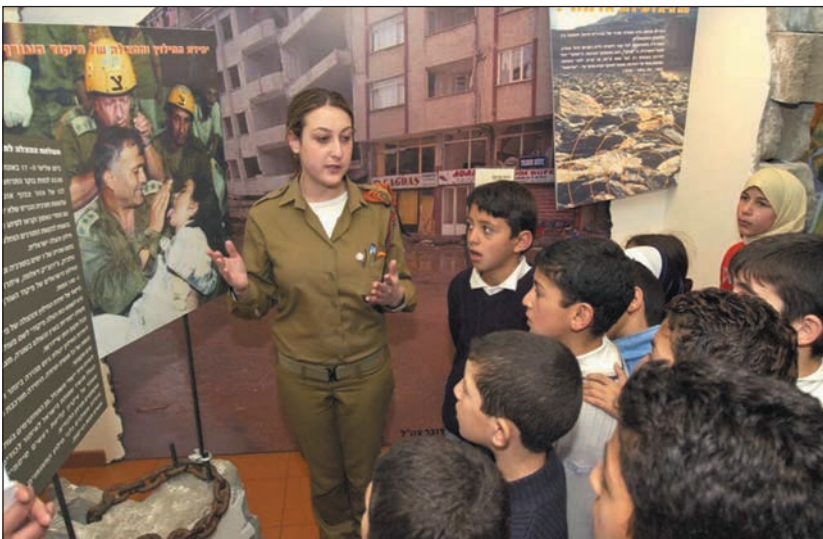
Izraeli katona arab gyerekeknek tart előadást elsősegélynyújtásról a jeruzsálemi természettudományi múzeumban

2015-ben a Kneszet elfogadta a 922. sz. programot, amely célul tűzte ki a zsidó és arab közösségek közötti egyenlőség csökkentését. Első lépésben az arab települési önkormányzatok 2,96 millió dollárnak megfelelő támogatást kaptak kommunális beruházásokhoz. Mára az arab lakások mintegy 85%-a rendelkezik modern csatornahálózattal a 2015. évi 40%-kal szemben. Jelentősen fejlődött a tömegközlekedés, új utak épültek. Az óvodák és szakképzési központok létesítése nagyban hozzájárult a foglalkoztatottság emelkedéséhez az arabok körében.