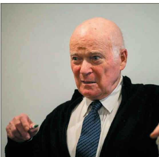
Moldova: beléptem a 88. évembe, nagy csodákra már nem vagyok képes

Első írásom 1955-ben jelent meg a Csillag című folyóiratban, és kedvezően fogadták. Ez annak is